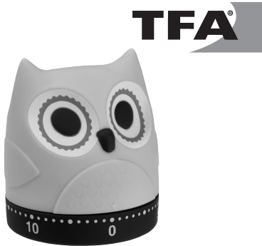
Kat. Nr. 38.1039

Vielen Dank, dass Sie sich für dieses Gerät aus dem Hause TFA entschieden haben.